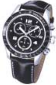
写真はブラックのダイヤルにブラックレザーストラップタイプ。

ティンV8 機能:クロノグラフ (30分計、60秒計、1/10秒計、add機能、スプリット機能)日付表示