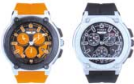
タイムックス アイアンマンドレスクロノ、31,500円(左)、29,400円(右)

米国ナンバーワンシェアを誇るTIMEX(タイムックス)からDフェイスのアナログモデル、「Ironman Dress Chrono(アイアンマンドレスクロノ)」が登場。「アイアンマンドレスクロノ」は、1986年に本格アスリートとインダストリアルデザイナーにより考案されたスポーツウォッチ、アイアンマントライアスロンシリーズのDNAを受け継ぐアナログモデルのクロノグラフだ。 アイアンマンドレスクロノ 機能:カレンダー、クロノグラフ(1/20秒計、秒計、分計)、インディゴロナイトライト、10気圧防水 ムーブメント:クォーツ ガラス素材:ミネラルガラス ストラップ素材:ラバーストラップ